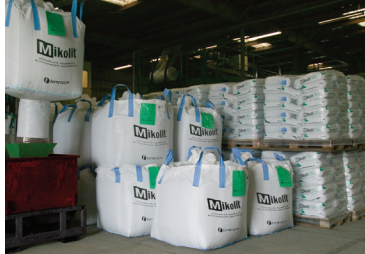
Big bags à 1000 kg