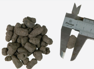
Pellet lengte 7 – 12 mm