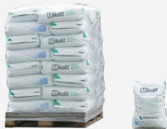
Zakken à 25 kg