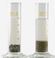
Zwilvermogen 30 – 40%